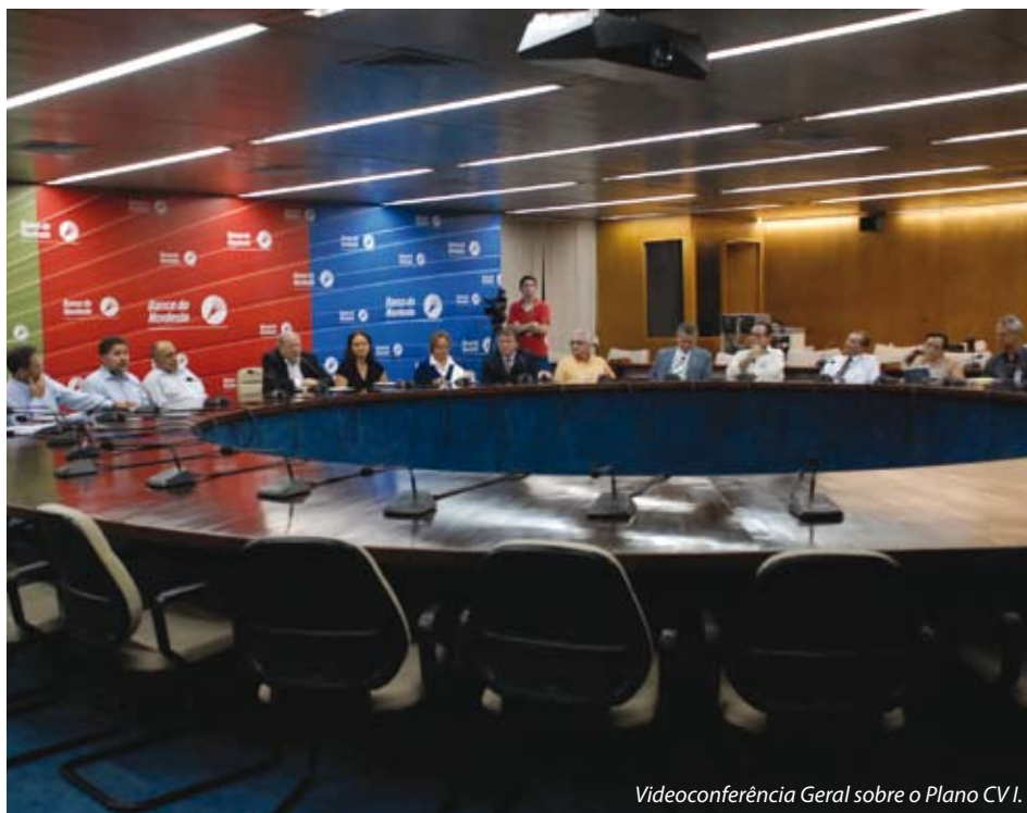
Videoconferência Geral sobre o Plano CV I.

Acompanhe no hotsite www.capef.com.br/planocv , videocasts sobre as principais vantagens do Plano CV I, contratação do tempo passado, regimes de tributação (IR) e comparativos do Plano CV I com planos de mercado. Profissionais da Capef especialistas em previdência falam sobre esses tópicos e esclarecem as principais dúvidas dos funcionários.